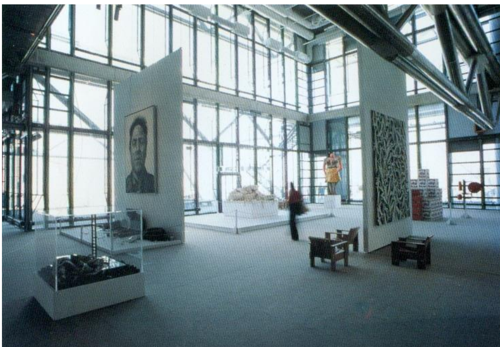
Oorspronkelijke opstelling van de kunstwerken in Centre Pompidou, (uit publicatie Dal Co)

In hun wedstrijdinzending waren de roltrappen aan de buitenzijde reeds aanwezig maar dan in een zig-zag verloop. In hun definitief project liggen de roltrappen in één lijn, als een rode, beglaasde slang opgehangen aan de gevel. Deze oplossing werd zelfs de logo van Centre Georges Pompidou. Het is misschien het meest betoverend deel van het gebouw. Met roltrappen kunnen veel meer mensen zich verplaatsen dan met liften, en gelijktijdig komt de bezoeker onder de indruk van het wonderlijk schouwspel van het Parijse stedelijke landschap. Alle bezoekers herinneren zich dit uitzonderlijk spektakel, vermoedelijk meer dan de kunstwerken van de collectie en de schitterende tijdelijke exposities.