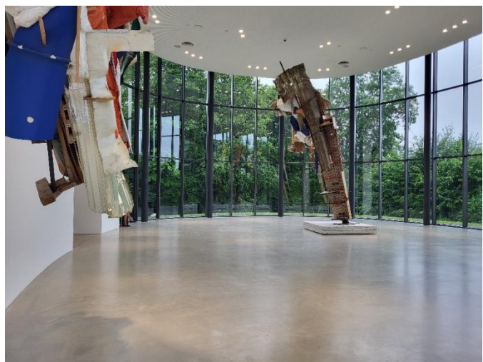
Tweede paviljoen met drie werken plus één wek buiten