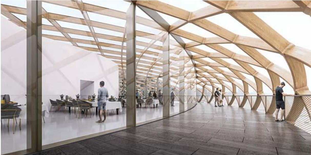
Panoramisch terras voorstel ZJA Presentatietekening Bureau Bouwgroep Nautilus

of opgroeide, zoals ik, weet dat bij stormweer de glasvlakken geleidelijk minder transparant worden door de zoutige zeelucht, een poetsbeurt is telkens noodzakelijk. Bekijk even de rendering van ZJA van de bovenste verdieping: een panoramisch uitzicht met een gebogen glaswand!. Men mag toch verwachten dat architecten oog hebben voor specifieke klimaatfactoren die bepalend zijn op een bouwlocatie.