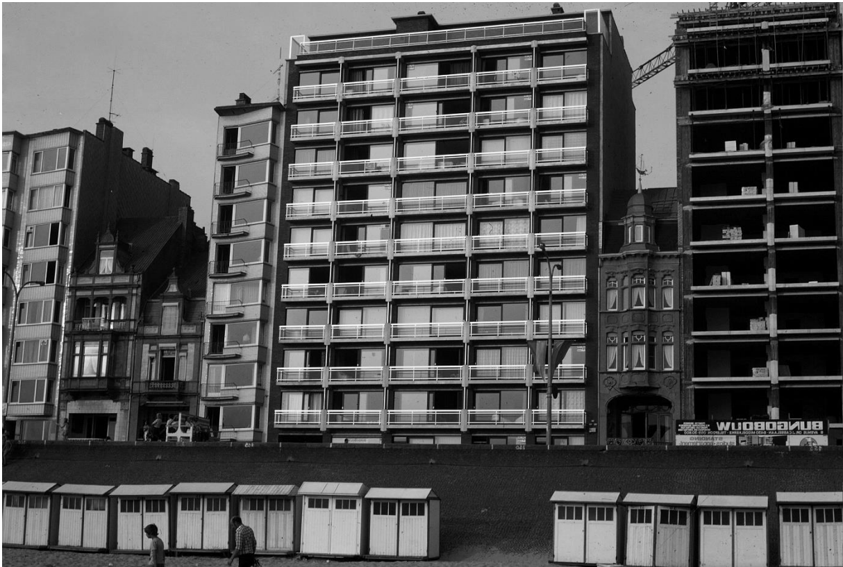
Middelkerke Zeedijk Rechts woning Doris, opname eind van de jaren '90