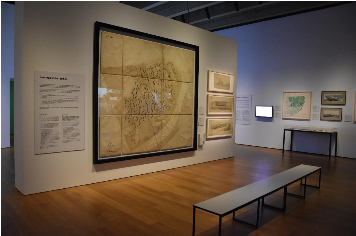
Plan LC voor de Linkeroever 1933 / i.s.m. Huib Hoste. Document Hoste Archief / CIVA Brussel

Zoals Bordeaux ontwikkelde Antwerpen zich aan één zijde van de rivier, aan de rechteroever. De linkeroever bleef tot in de jaren '30 een open vlakte, een agrarisch gebied. De aanleg van de tunnels onder de Schelde, geopend in september 1933, was de eerste en noodzakelijke infrastructuur om een toekomstige stadsuitbreiding op de linkeroever levensvatbaar te maken.