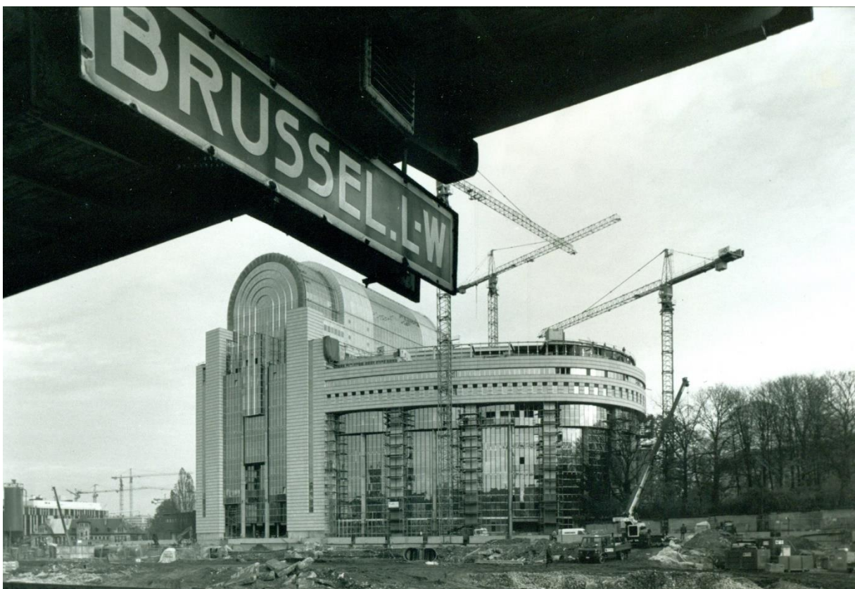
"Caprice des Dieux" in aanbouw.