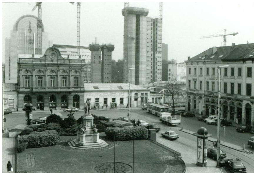
Luxemburgplein september 1992

De band tussen de burgers en het Europees project is steeds een terugkerend thema. De kloof dichtend tussen de Europese instellingen en de inwoners van Europa moet volgens velen een prioriteit zijn. Kan men zich even inbeelden wat de reactie is van de burger bij het vernemen dat een Europees gebouw moet worden gesloopt na 25 jaar? Geldverspilling in het kwadraat, onverantwoord beleid van een instelling die wij beter afschaffen! Wat vergeten wordt is dat het Paul-Henri Spaakgebouw een Belgisch initiatief was, de Federale overheid en niet Europa. De omvang van geldverspilling is nog groter dan zitpenningen bij één of andere organisatie of vzw die recent in de pers werden uitgebracht.