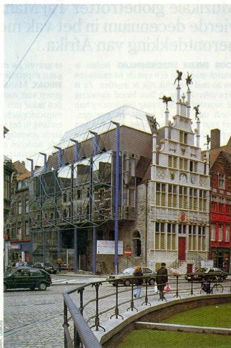
Het Gentse Metselaarshuis: ondermaatse travestie.

sante architectuur is er de bijna totale duisternis. Een stadsbestuur dat zich in 1986 met het projekt „Architectuur als buur” als voorbeeld wilde stellen slaagt er niet in om iets behoorlijks toe te voegen aan het stedelijke milieu. Een van de redenen is de monopoliepositie van ar-