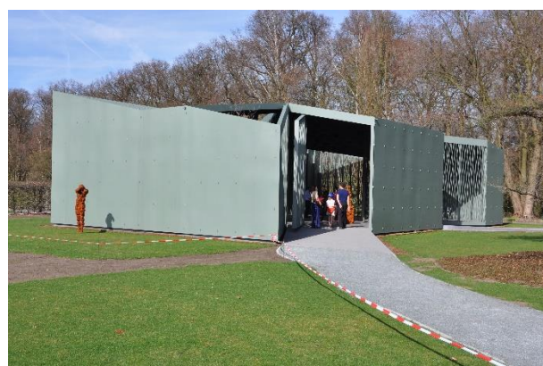
Brugge Concertgebouw / Antwerpen Middelheim paviljoen "Het Huis"

Het is opmerkelijk dat de gebouwen van R&D een uitgesproken zeggingskracht bezitten zonder te vervallen in opzichtigheid met gebogen lijnen die de computer kan opleveren. Het oeuvre ontsnapt aan de dorre functionaliteit die veel high-tech gebouwen kenmerkt en aan het vormelijke geweld dat enkel een misplaatse dynamiek wil uitdrukken. Er zijn er maar weinigen die een dergelijke sculpturale handigheid bezitten waarbij de band tussen exterieur en interieur wordt benut. Reeds in 1989 toont R&D met het BAC gebouwtje in Kerksken hoe architectuur een complexe gelaagdheid kan krijgen. Referenties naar een landelijke schuur, de lessen van Palladio als een inwendige plasticiteit die Álvaro Siza op dat moment ons toonde. Juist deze symbiose van verschillende invloeden is boeiend; er wordt niet gekopieerd maar getransformeerd tot iets nieuws. Er zijn weinig architecten die zo goed de architectuurerfenis kennen als Paul Robbrecht.