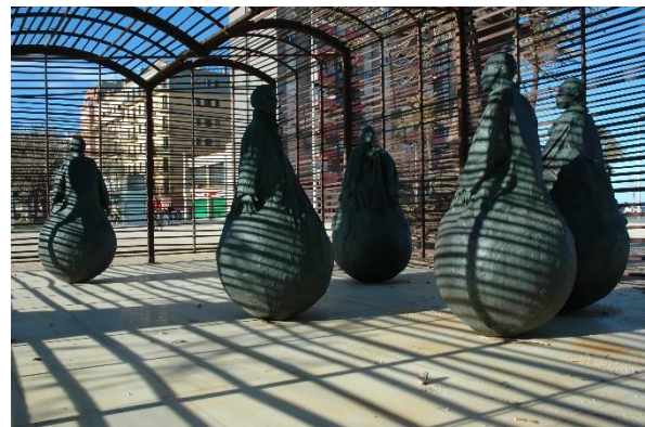
Barcelona / "The house where it always rains" foto Marc Dubois

Het boek bevat ook een PS, een project met een grote emotionele betekenis. In Barcelona staat het werk "The house where it always rains", een transparante metalen structuur waarbinnen de beelden van Juan Muñoz staan opgesteld. Muñoz was een intieme vriend van R&D en zijn plots overlijden in 2001 raakte hen erg diep. Een eerbetoon dat verder reikt dan het produceren van gebouwen!