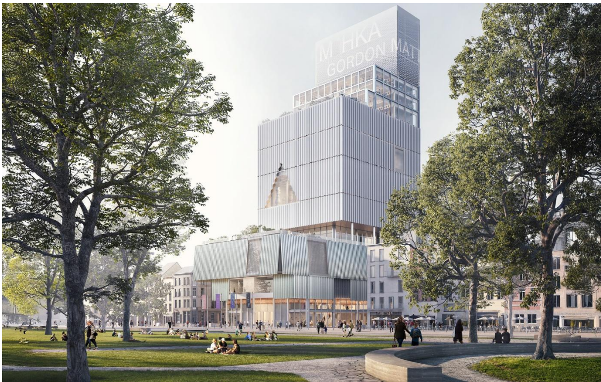
© Bovenbouw Architectuur en het Zwitserse architectenbureau Christ & Gantenbein / website Vlaamse Bouwmeester.

Eind februari 2025 werd gekozen voor het Antwerpse kantoor Bovenbouw Architectuur en het Zwitserse architectenbureau Christ & Gantenbein. Het Zuid zou een "iconische landmark" krijgen met een hoogte van 80 meter. Ondertussen is men bezig met het RUP (Ruimtelijk Uitvoerings Plan) aan te passen voor de nieuwe bouwhoogte, een goedkeuring die eind 2025 wordt verwacht. De beslissing van de Vlaamse Regering om het bouwproject van 130 miljoen euro te schrappen kwam begin oktober aan als een donderslag bij heldere hemel. Dat men in zware besparingsrondes overal op zoek moet gaan naar centen is begrijpelijk. Tweemaal architectenbureaus aan het werk te zetten om uiteindelijk er niets mee te doen is ongezien. Architecten zijn niet verantwoordelijk voor de keuze van een bouwterrein. ER is een uitspraak "van een washandje kan je geen handdoek maken" . Werd een grote verspilling van energie, geld en veel ook frustraties.