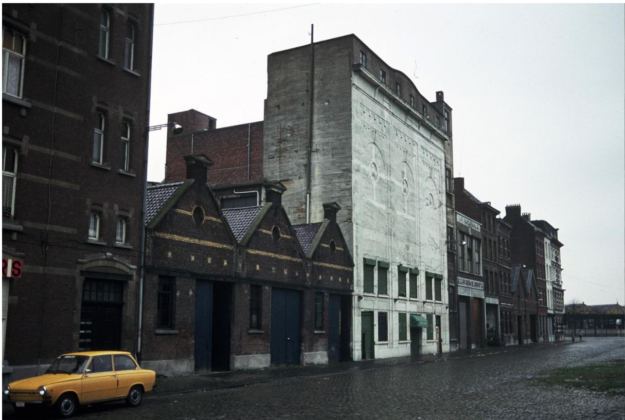
De slechtste aankoop van Vlaanderen, een silo aan de Leuvenstraat Antwerpen Zuid Daar begon de ellende met gevolgen tot op heden.

De Vlaamse Gemeenschap beslist in 1982 om het M HKA op te richten, Antwerpen verdient een museum voor hedendaagse kunst. In 1985 werd een voormalige graansilo aangekocht met een oppervlakte van 1500 m 2 . In september 1985 werd het M HKA officieel opgericht en op 20 juni 1987 was er de opening van het museum zonder collectie.