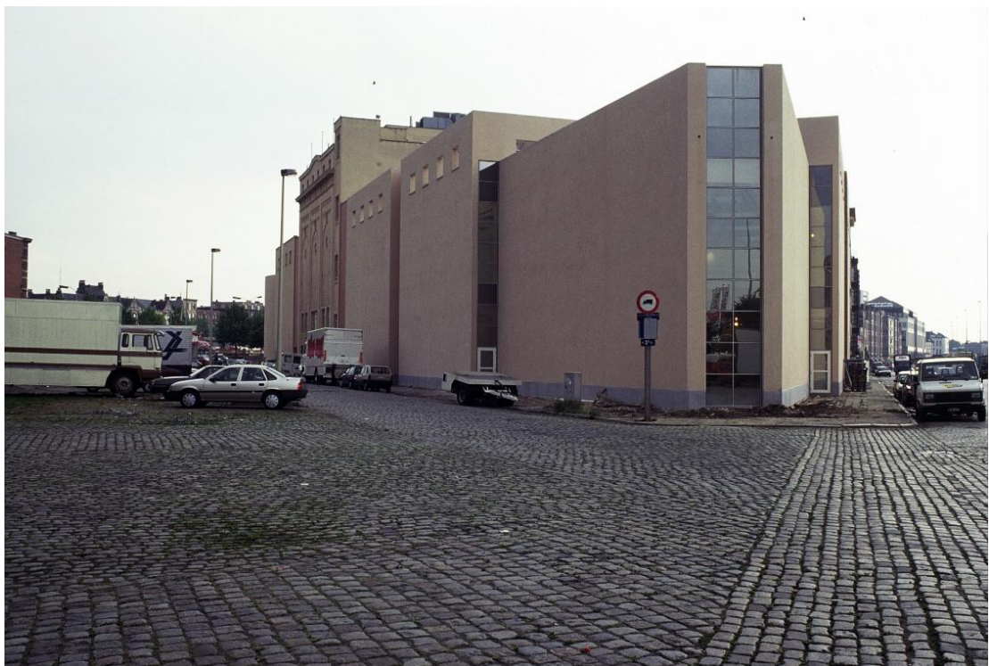
M HKA na de uitbreiding richting Schelde

De verbouwde silo is een mislukking geworden omdat het industrieel karakter totaal verdween achter de witte bepleistering.